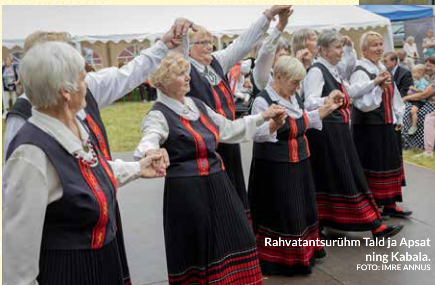
Rahvatantsurühm Tald ja Apsat ning Kabala.