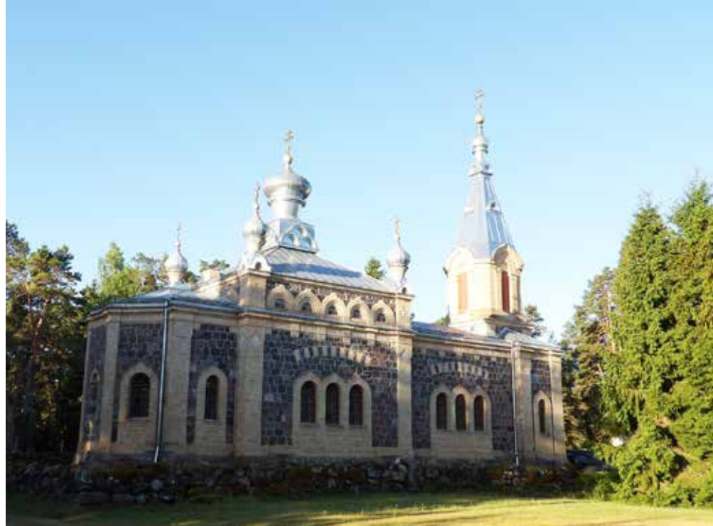
Kuriste Jumalasünnitaja Sündimise kirik Hiiumaal.

Vaatamata harmoonia ja meloodiate lihtsusele pole aga kirikulaulude omandamine ka enda meelest kogunud koorilauljale nii lihtne, kui võib esialgu tunduda. Konkreetse meetrumi ja taktimõõduga hästi struktureeritud muusikast tuleb ümber häälestada tekstipõhisele kõlavale esitusviisile (sarnaselt gregooriuse laulule), kus meloodiahelid tuleb jaotada erineva pikkusega tekstiridadele. Osal lauludest on olemas väljakirjutatud noodid, mis võivad pärineda idakirikute erinevatest piirkondadest ning