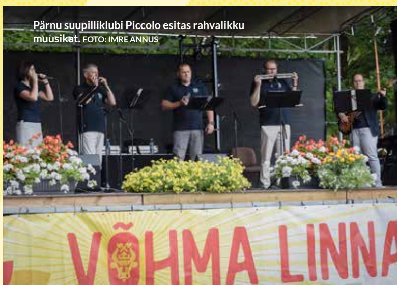
Pärnu suupilliklubi Piccolo esitas rahvalikku muusikat.