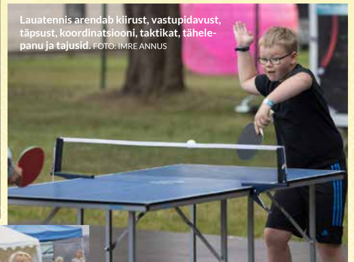
Lauatennis arendab kiirust, vastupidavust, täpsust, koordineerimist, taktikat, tähelepanu ja tajusid.