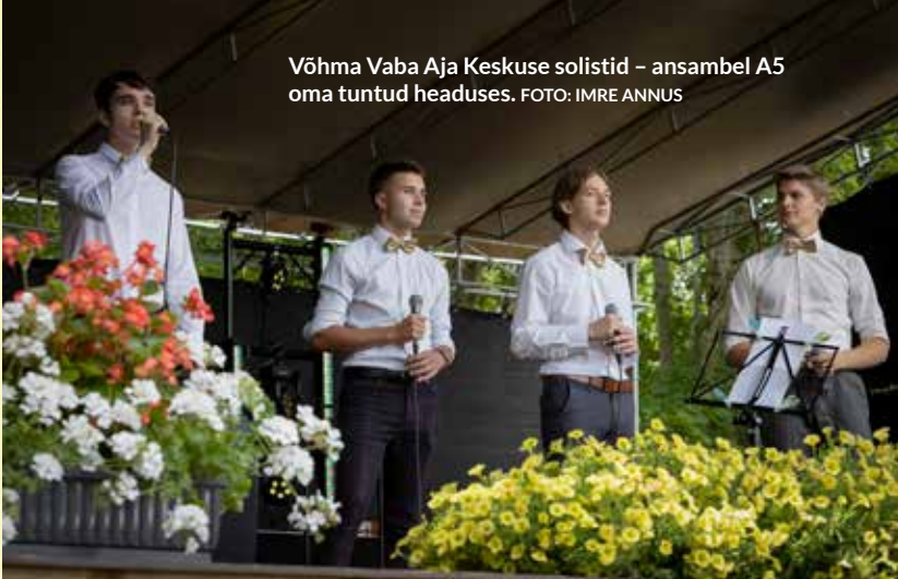
Võhma Vaba Aja Keskuse solistid – ansambel A5 oma tuntud headuses.