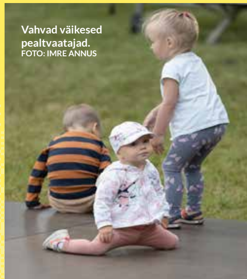
Vahvad väikesed pealtvaatajad.