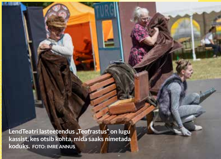
LendTeatri lasteetendus „Teofrastus“ on lugu kassist, kes otsib kohta, mida saaks nimetada koduks.