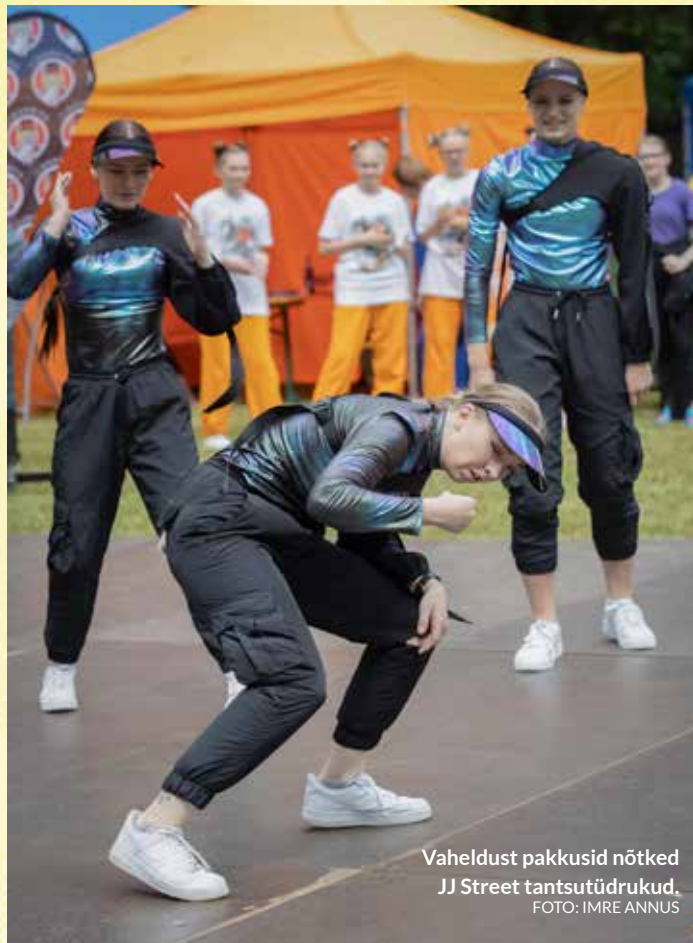
Vaheldust pakkusid nõtked JJ Street tantsutüdrukud.