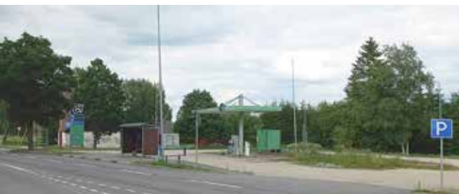
Kõpu tankla kinnistu täna.

Linnaruumi pilkupüüdvaid atraktiivseid detaile luua ja tuua ei olegi lihtne ülesanne. Kui see pisike siga suudab kellegi päeva pisut rõõmsamaks muuta, siis on ta seal posti otsas oma eesmärgi täitnud.“