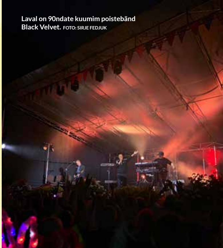
Laval on 90ndate kuumim poistebänd Black Velvet.