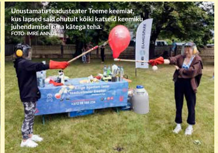
Unustamatu teadusteater Teeme keemiat, kus lapsed said ohutult kõiki katseid keemiku juhendamisel oma kätega teha.