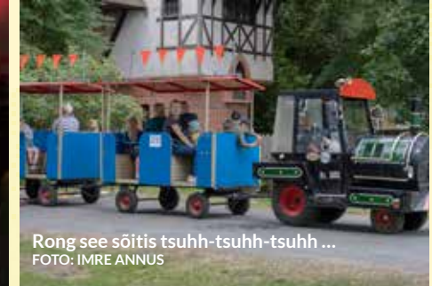
Rong see sõitis tsuhh-tsuuh-tsuuh ...