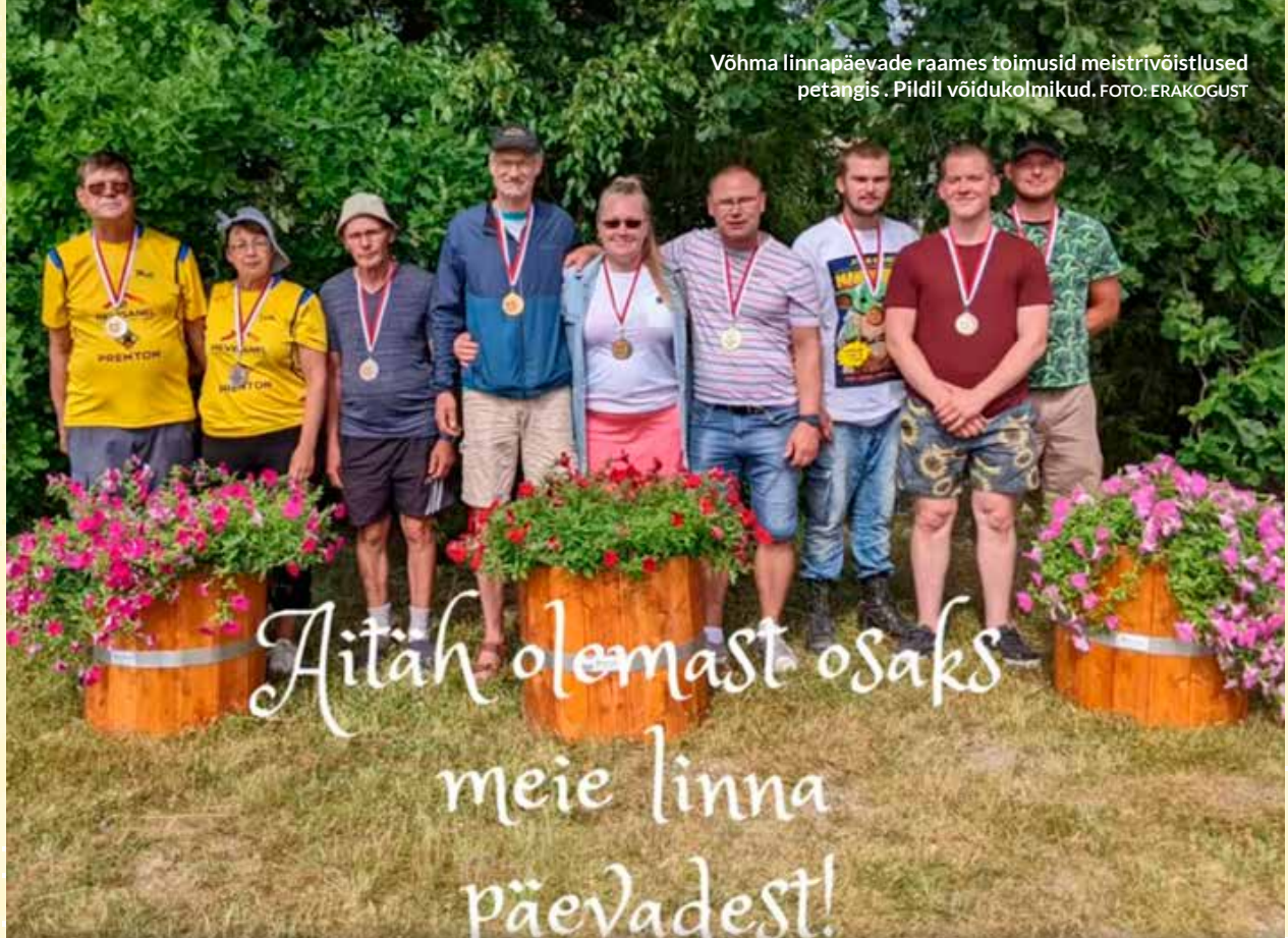
Võhma linnapäevade raames toimusid meistrivõistlused petangis. Pildil võidukolmikud.

Aitäh olemast osaks meie linna päevadest!