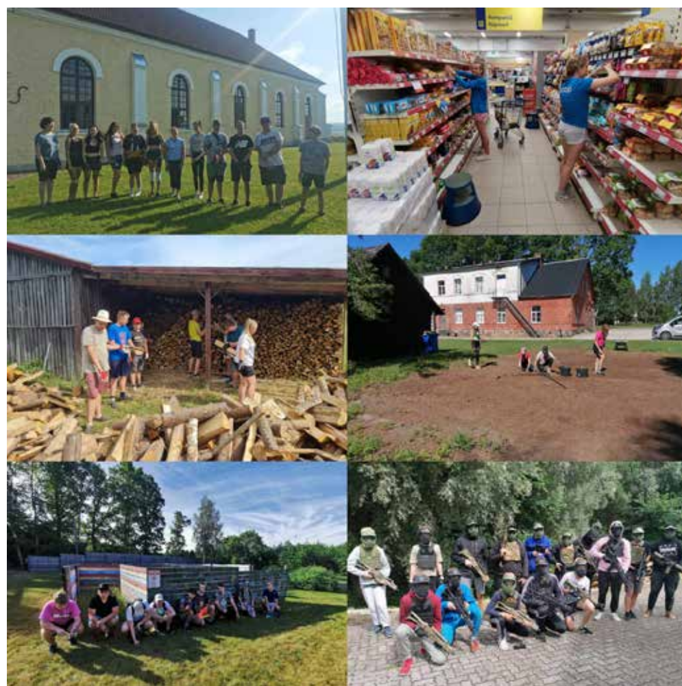
Ülevalt vasakult paremale: 1. Kõpu töömalevlased Kõpu kiriku juures; 2. Võhma noored Coopis tööl; 3. Kõo malevlased puud ladumas; 4. Paala rahvamaja heakorratööd; 5. Suure-Jaani noortekeskuse labürindi lammutus; 6. Viljandis airsofti mängimas.

Noortele jätkus ka palju meelelahutust pärast tööd – näiteks käidi kinos, peeti piknikku ja