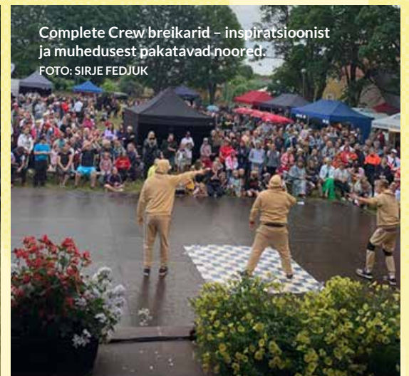
Complete Crew breikarid – inspiratsioonist ja muhudest pakuvad noored.