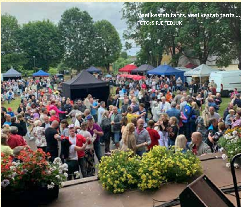
Veel kestab tants, veel kestab tants ...