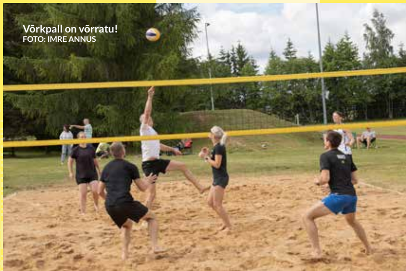
Võrkpall on võrratu!