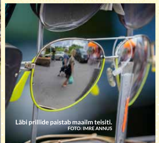
Läbi prillide paistab maailm teisiti.