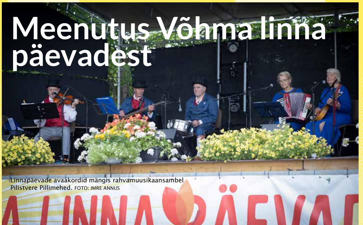
Linnapäevade avaakordid mängis rahvamuusikaansambel Pilstvere Pillimehed.