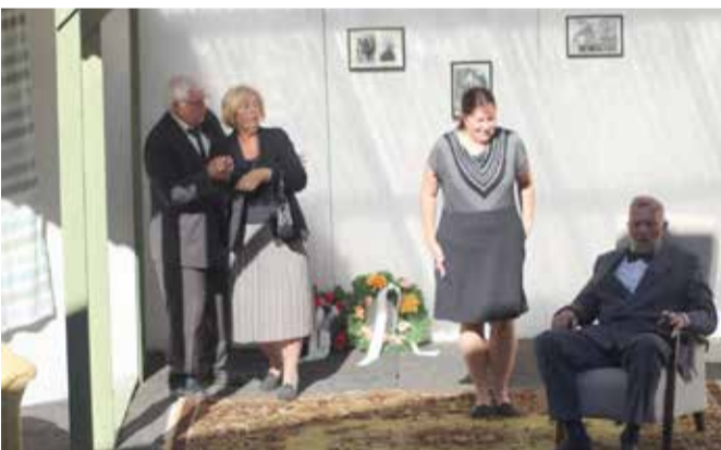
Suure-Jaani näitetrupp Tegelt kah.