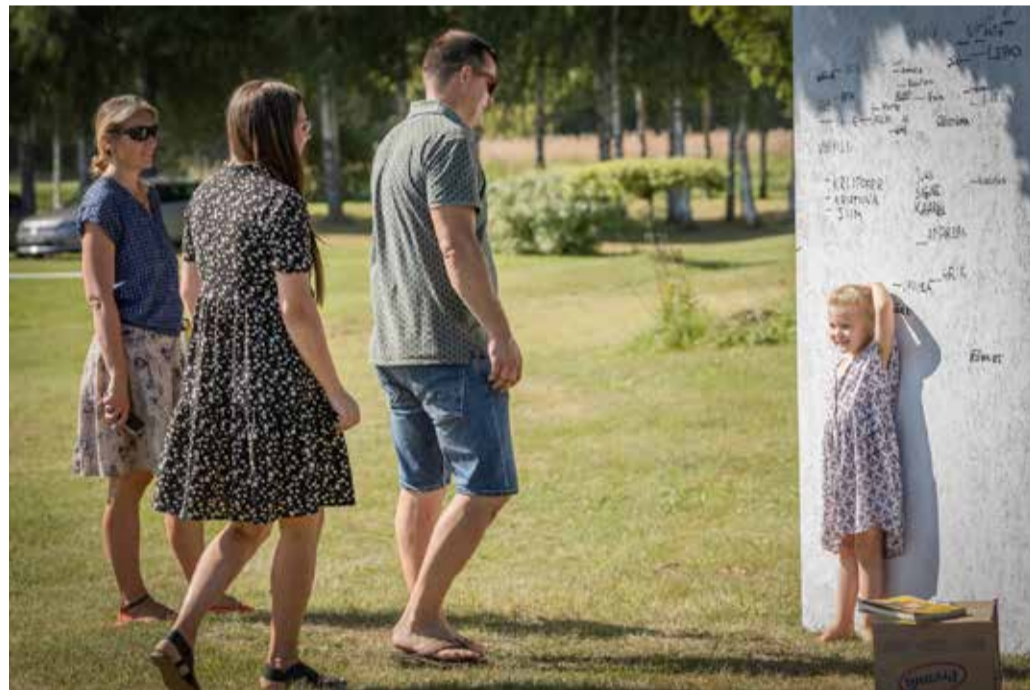
Hoovipidu põnevate mängudega Mulgi talus.