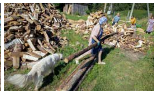
Puuriida ladumise talgud Raistiko talus.