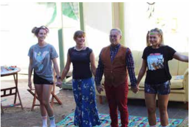
Vastemõisa näitetrupp Karneool.