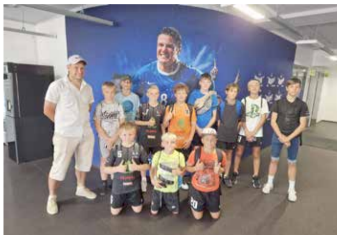
Täaksi jalgpallipoisid Tallinna Legendide mängul.