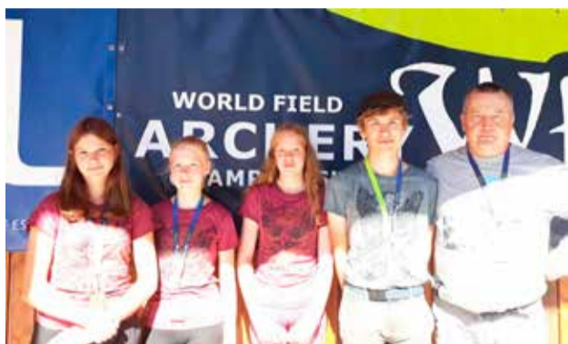
Meie vibulaskjad said medalid kaela.