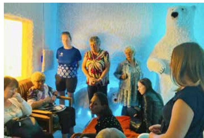
Urga hooldekodu soolakambris.