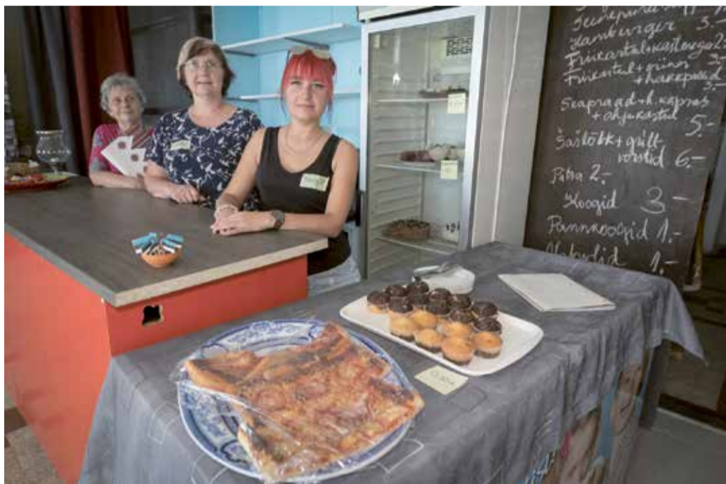
Endise Pilistvere poe ruumides ootas kohvik ja lahke pererahvas.