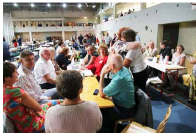
Vilistlastel oli rõõm kohtuda vanade klassikaaslastega.