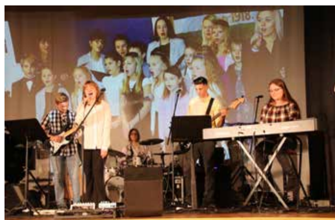
Suure-Jaani muusikakooli bänd.