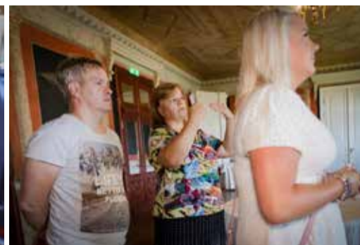
Suure-Kõpu mõis peidab endas avastamisrõõmu.