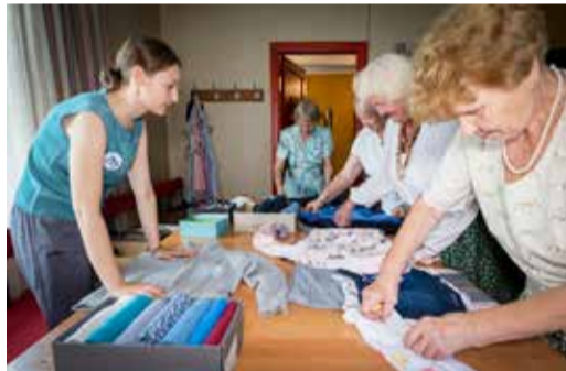
Koksvere seltsimajas õpetati lihtsaid võtteid riiete voltimiseks.