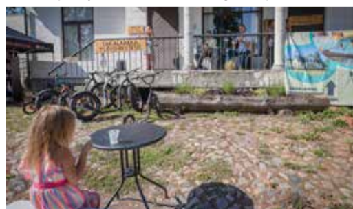
Endine Kõpu külastuskeskus kannab nime Sakalamaa turismikeskus ning on avatud kõigile huvilistele.