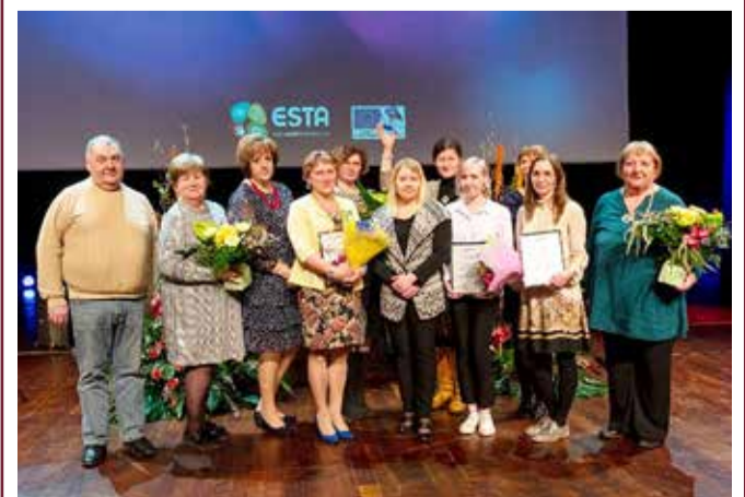
Sotsiaalvaldkonda töötajate tunnustusürituse laureaadid aastal 2022.