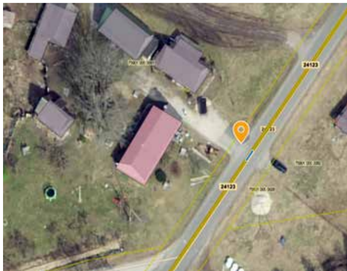
Skeem 2. Võlli-Kingu peatus.

Eelnõu on leitav https://www.pohja-sakala.ee/et/majandusosakonna-teated .