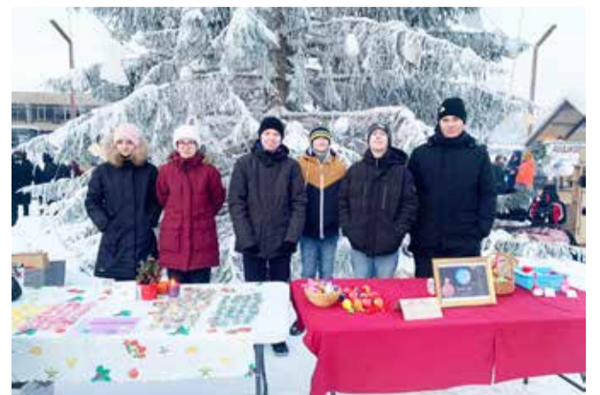
Suure-Jaani kooli õpilaste minifirmad Viljandis toimuvail õpilaste firmade laadal.