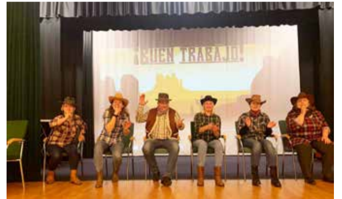
Õpetajate etteaste gümnaasiumi jõulupeol.