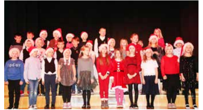
Laval 1. klassid jõuluvanale esinemas.