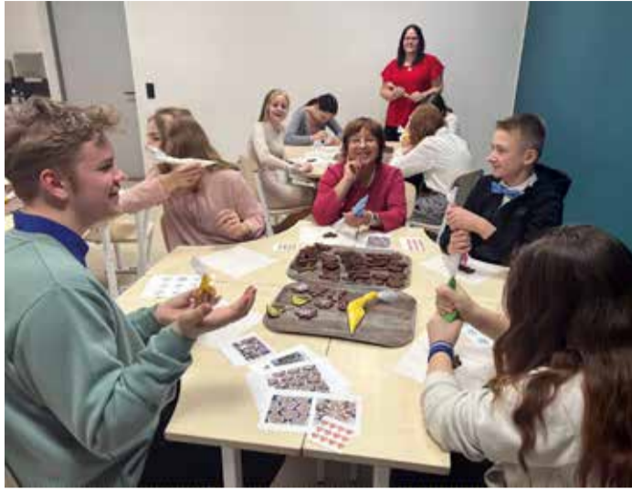
Piparkookide kaunistamine ja rahvuslikud mängud.

Stiilselt jätkus ka jõulunädal. 19.–21. detsembrini olid koolis jõuluteemalise riietuse päevad. Esmaspäeval oli teemaks päkapikud, luumemmed ja jõulukaunistused, teisipäeva teema oli punane ja kolmapäeval pidulikult jõulune. Nii õpilased kui ka õpetajad olid oma kostüümidega vaeva näinud ja nii muutusid koolipäevad huvitavamaks, eriliseks ning mõnusalt jõuluseks, seda ka aeg-ajalt kokanduse klassist ja sööklas-