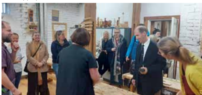
Haridustöötajad Prantsusmaalt Lahmuse koolis.

jooksul kaasavad nii õpetajad kui ka kasvatajad lapsi erinevatesse tervise- ja tegevustesse. 10.–14. oktoobrini oli meie koolis tervisenädal, kus mõõdeti nii õpilaste kui ka koolitöötajate pikkust ja ka jalalaba pikkust, et saada selle sügise tulemuse võrrelda järgmisel aastal. Veel räägiti hammaste ja käte pesemisest ja selle olulisusest. Mängiti piimatoodete ja ohutusalaste teadmiste mängu ning ehitati üheskoos toidupüramiidi. Isade- ja meesepäeva puhul läbi viidud mehise nädalal said noormehed tutvuda mehiste ametitega, mõõtu võtta erinevatel spordisündmustel, aga ka tantsusamme seada ühistel tantsuvahetundidel. Kooli naispere oli aga žüriis, kes valis kõige paremini tantsivat poissi.