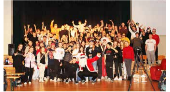
Peo korraldavad 8. klassi õpilased. Selle aasta teemaks hip-hop.