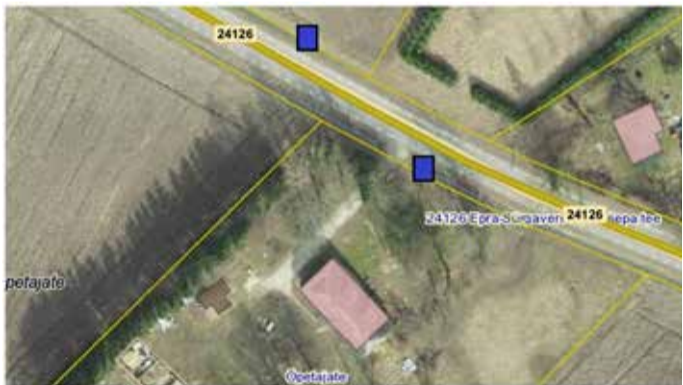
Skeem 1. Õpetajate peatus.

Kirjalikud ettepanekud saata aadressile Lembitu pst 42, Suure-Jaani või e-posti aadressile info@pohja-sakala.ee.