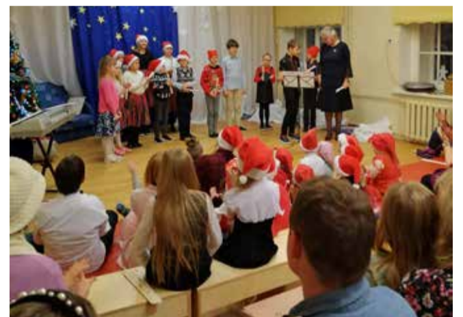
Tääksi tegutsemiskoha lasteaja ja kooliõpilaste ühine jõulupidu.