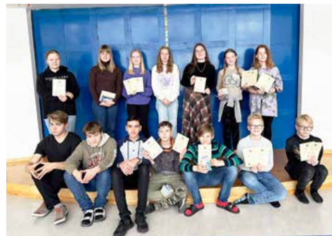
Olustvere põhikooli parimad.