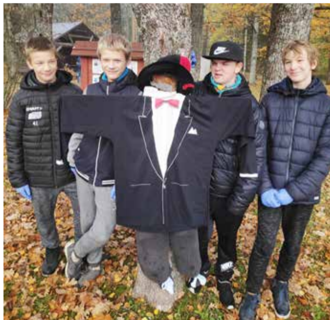
Õuesõppe päev Urvastes.

Kui tavaliselt on koolides teemapäevad, siis Lahmuse koolis tehakse asju ikka mõnuga. Seetõttu ongi meil teemanädalad, näiteks tervisenädal, kus terve nädala