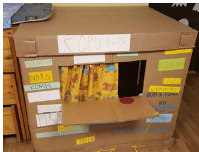
Kõpu lasteaias käis vilgas kauplemine.