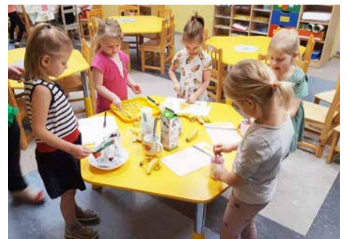
Sipsikud ametis: Ise teeme, ise sööme!