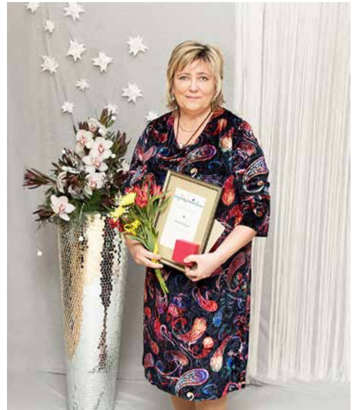
Meenutus 2018. aastast.