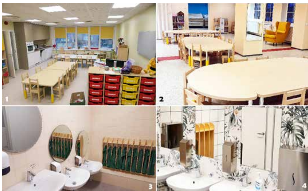
Suure-Jaani lasteaed Sipsik (fotod 1 ja 3), Vastemõisa lasteaed Päevalill (fotod 2 ja 4).

Lasteaia direktor Riina Kukk: „Uute ruumide üle rõõmustavad eelkõige koolieelikud, kes uutesse ruumidesse koos õpetajatega kolivad. Kuna ruumid asuvad maja teisel korrusel, siis koolieelikute rühmaruumideks need edaspidi jäävadki. Koolieelikute poolt tühjaks