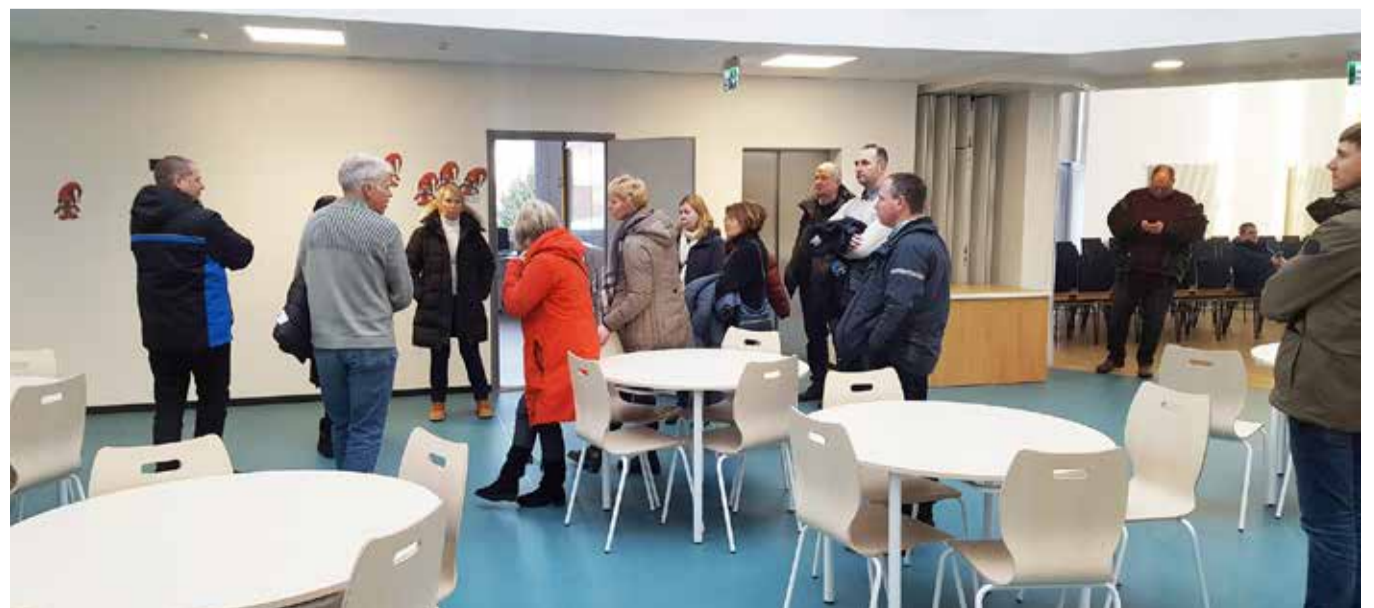
Võhma kooli aatriumis.