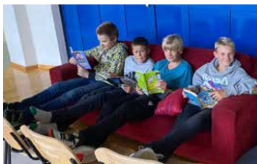
Raamatute lugemise väljakutse osutus edukaks.