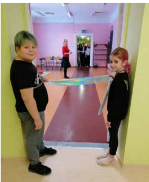
Lahmuse kooli lapsed aitavad saali avada.

Lahmuse koolis avati 23. jaanuaril renoveeritud ruumid teisel korrusel, et pakkuda õpilastele üha uusi võimalusi nii õppetöoks kui ka paremaks vaba-aja veetmiseks. Uuenduskuuri läbisid nii raamatukogu, huvijuhhi ruum kui ka roosa saal, kus nüüdsest saavad lapsed mängida erinevaid mänge, lugeda raamatuid, joonistada või siis lihtsalt niisama vaikselt istuda. 23.-27. jaanuarini