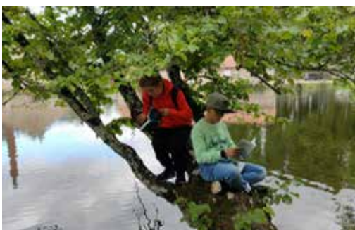
Lugeda saab igal pool ja igal ajal.

lugemise challenge'iga, mille võistluslikkus seisnes selles, et välja selgitada klass, kes loeb perioodil september kuni detsember kõige rohkem. Eesmärk ei olnud niivõrd leida võitja, kuivõrd suunata õpilasi rohkem lugema ja välja tuua nutimaailmast. Mo-