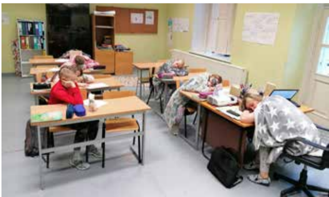
Pidžaamapäev sõbrapäevade nädalal.

Esmaspäev oli piduliku riietuse ja ebaharilike koolikottide päev. Õpilased olid asja võtnud tõsiselt ja mõnel lapsel oli „koolikott“ õpilasest suuremgi. Teisipäev oli roosa ja punase riietuse päev. Need värvid olidki sel päeval kõvasti ülekaalus ja neid jagus isegi spordiriistele. Kolmapäev oli pidžaamade ja tudukate päev. Lisaks oli majja ilmunud kaisukaid ja mõnel oli oma padi ja pleed kaasas, et väsitaval koolipäeval puhata saaks. Ja puhkajaid jagus nii mõnessegi tundi. Neljapäev oli spordiriistepäev. Kui õpilased ka muudu armastavad pigem spordiriistepäevadeid kanda, siis sel päeval oli dressifanne kõvasti rohkem. Reedel oli pilt majas hoopis kirju – nimelt said soovijad kanda hoopis vastassugupoole traditsioonilist riietust. Ja oi neid poisse, kes siis olid neiudeks muutunud – neid jagus pea igasse klassi.