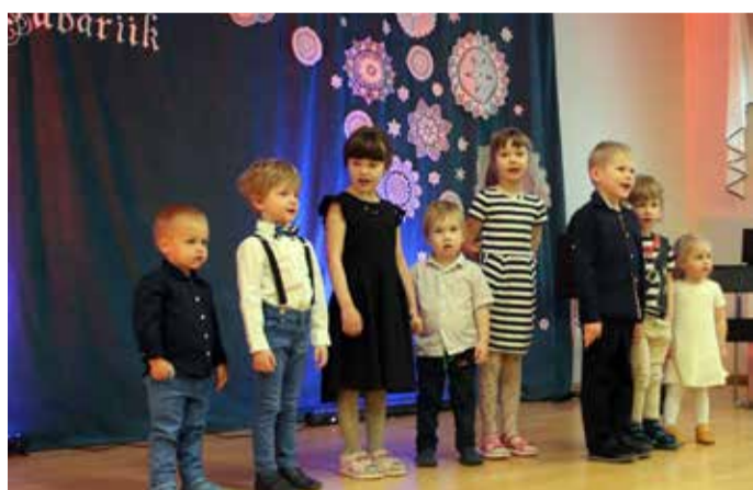
Kõige pisemad esinejad Sürgaveres.