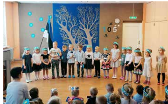
21. veebruaril tähistas Võhma lasteaias Mänguveski Eesti Vabariigi sünnipäeva piduliku aktusega.