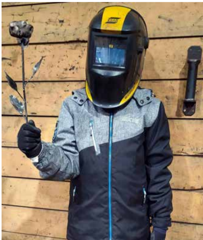
Igavesti õitsev roos valmis „Tööle kaasa“ päeva lõpuks.