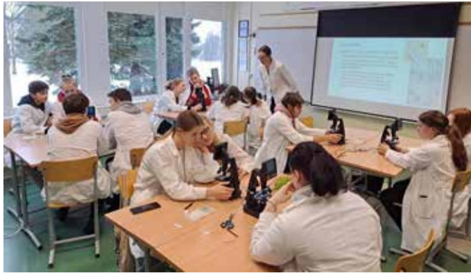
7.-8. klass Taibukate Teaduskoolis bioloogia õppelaboris.

Aasta 2023 algas Võhma koolis „suure pauguga“. Nimelt oli meil külas ansambel Äge Brass kavaga „Suur pauk. Muusika tegi ahvist inimese“. Võib öelda, et tegemist oli lausa ajalootunniga, millesse oli kombineeritud muusika ja instrumendid. Instrumendid ning nende kasutamisel tekkinud heli on aga puhas füüsika, mis pani tantsima isegi meie füüsikaõpetaja. Kontsert algas kiviajaga ning jõudis välja tänapäeva. Kogu kontserdi jooksul räägiti erinevatest muusikainstrumentidest, mida inimesed on läbi aegade kasutanud. Tõestati, et ka kõige lihtsamate ja algelisemate