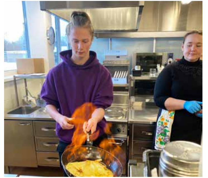
8. klass Järvamaa kutsehariduskeskuses.

8. klassi õpilased läbisid 20. jaanuaril Järvamaa kutsehariduskeskuses oma valitud toitlustus-puhastuse ja põllumajanduse töötoa. Õpilased said selgeks, kuidas on õige puhastada erinevaid pindasid ning tutvuti erinevate puhastusvahendite ja -tehnikatega (sh toore muna koristamine pörandalt). Kõik olid ühel meelel, et kõige huvitavam oli teha pannkooke, sh need n-ö põlema panna ning hiljem ära süüa.