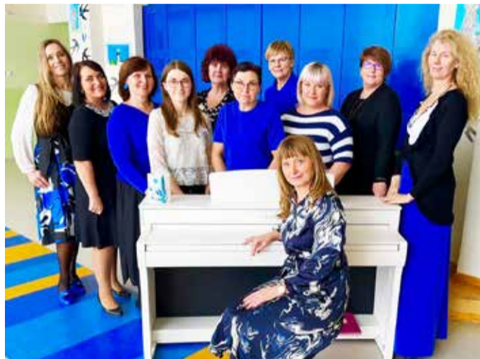
Olustvere õpetajad – stiiliks rahvusvärvid.