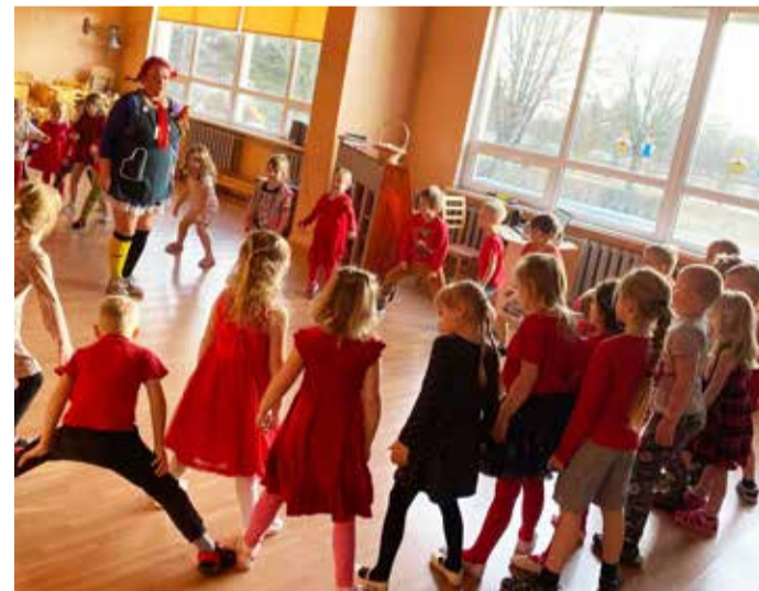
Võhma lasteaias Mänguveski tegemised sõbrapäeval: ühise südame tegemine (pildil vasakul) ja sõbrapäeva trall koos Pipiga.