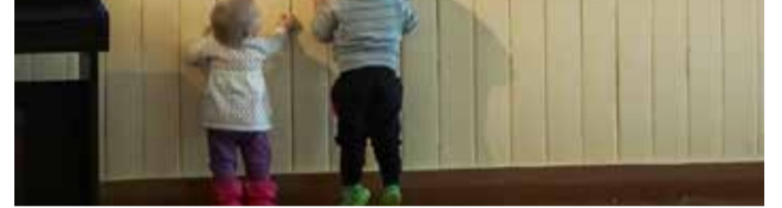
Fänniklubi: Kust sirguvad tulevased muusikud?