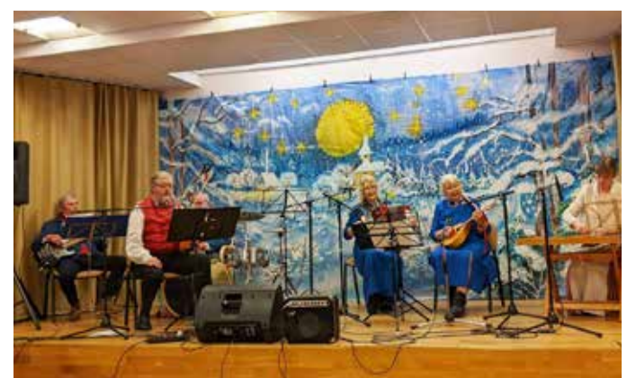
Võhma Vaba Aja Keskuses.