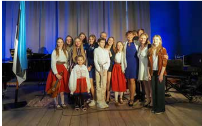
Pidulik sünnipäevakontsert „Eesti Vabariik 105“ Kondase majas.