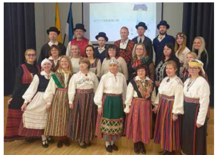
Võhma kooli õpetajad – stiiliks rahvarõivad.