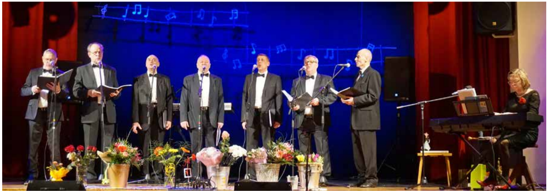
Kolmekümne viiased Pange Poisid.

Pange Poisid teevad lauluproove täna Viljandis, Ingeri majas, kuid nad on alati olnud Vastemõisa rahvamaja bänd