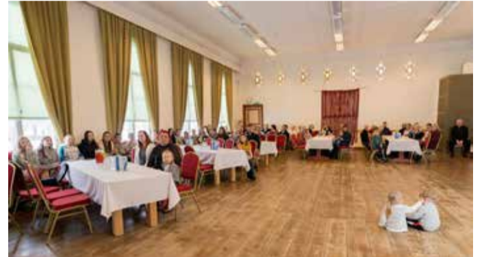
Pilistvere rahvamajja kogunes kenake hulk rahvast.