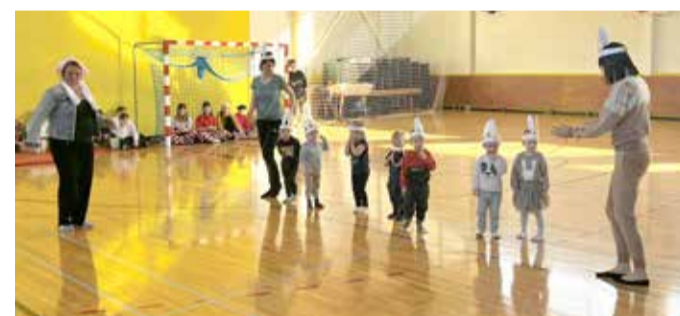
Liikumispoo noorimad osalejad – Oakeste rühm.

8. ja 9. klassi õpilased kaitsesid oma loovtöid veel enne vaheaega. Seekord oli valdav osa loovtöödest praktilised tööd. Ehitusmaterjalina kasutati valdavalt puitu, millest valmis kassipesa, kassi ronimispuu, tööriistariiu, lukustatav suur kirst. Lisaks näidati õblemisoskust ning valmis seljakott, mis suvistel käikudel vajalik abivahend. Esmaordselt tehti loovtööna hõbeheiteid, st õpilane ise sulatas hõbeda ja vormis meelepärased ehted. Ühes loovtöös tutvustati algklassiõpilastele meeskonnamängusid, mida kehalise kasvatuse tunnis kasutada. Praktiliste tööde kõrval uuriti ka pere koolilugu ning põllumajandusettevõtte ajalugu. Taaskasutus on saanud märksõnadeks mitmete loovtööde juures, vanale asjale antakse uus elu – nt vanaisa vanast raadiost valmis kassipesa.