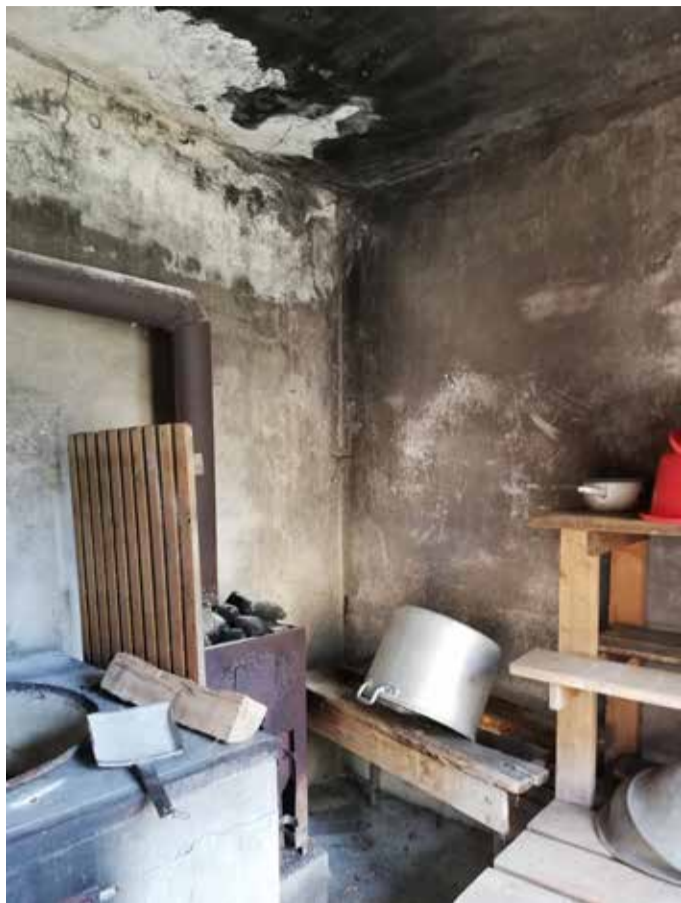
Enne ja pärast.