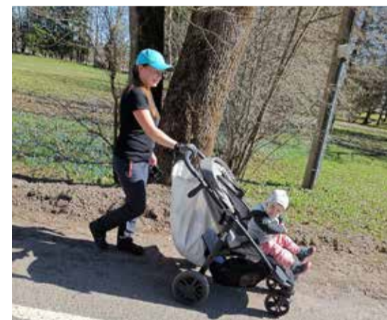
Kahekesi on lõbusam!