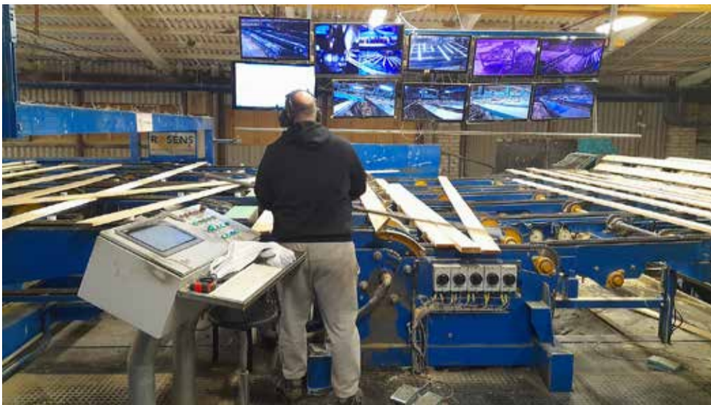
Tootmisliin Combimill Sakala OÜ-s...

Tehas valmis Combimill Sakala saeveski kõrvale 2013. aastal. Praegu töötab ettevõttes 85 inimest. Põhiliselt läheb