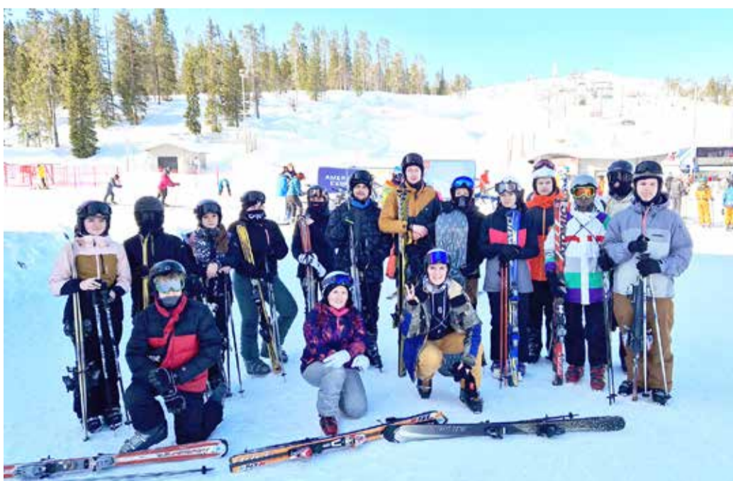
Põhja-Sakala valla noored ja juhendajad Ruka mäesuusalaagris.