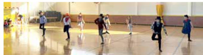
4. klassi liikumiskava – line-tants.

2023. aasta on liikumisaasta, Ullo Toomi aasta ning laulu- ja tantsupeoaasta. Seda kõike tähistasime 19. aprillil lasteaia ja kooli ühise liikumispöega, kus olid ka üllatuskülastused. Juhisena oli antud, et liikumiskava muusika oleks eestikeelne, muus osas olid esinejatel ja rühmadel vabad käed. Lasteaed esitas Sipsiku ja Leopoldi võimlemist, poritantsu ja vanim rühm hoogsa zumba kava. Kooliõpilaste kavades oli nii õpilaste omaloomingut kui rütmikaõpetaja juhendatud liikumiskavasid. Ühes kavas kutsuti lausa publik kaasa tantsima. Tantsimis- ja liikumisrõõmu osaliseks said aga kõik osalenud, lasteaialapsed esinemiskogemuse suure publiku ees. Üllatusesinejateks olid õpetajad, JJ Street tantsurühm ning rahvatantsurühm Tald ja Apsat. Aitäh kõigile osalejatele.