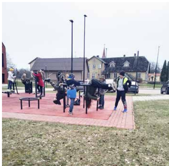
Kehalise kasvatusetunde väljõusaalis