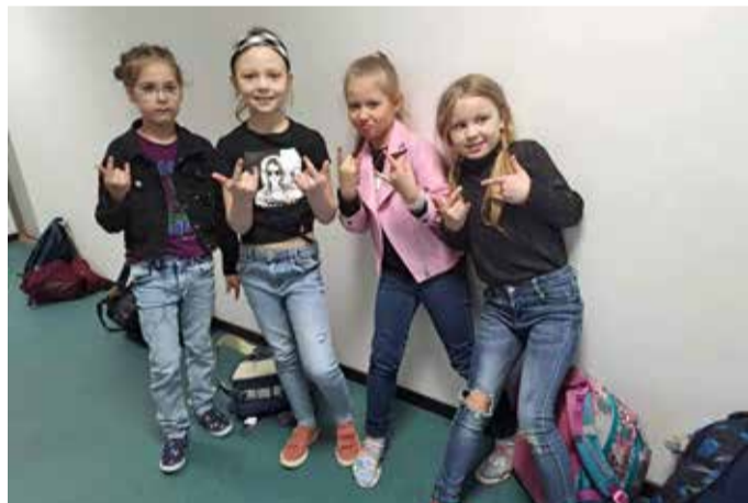
Kool rokib – rocki stiil.

1. aprill oli sel aastal nädalavahetusel, kuid ega koolielu naljata ei möödu. Aprilli esimesel koolipäeval oli stiiliks kokkusobimatu riietus ning lisaks rakendus koolikoti keeld. Õpilased lahendasid koolikoti mure väga leidlikult. Koolimaja oli nagu üks suur segasummasuvila. Naljapäev oli väsitav, mistõttu järgmisel päeval jõuti kooli uneriietes ja keegi ei pannud seda tol päeval pahaks – stiiliks oligi uneriided. Kolmapäevast neljapäevani kulgesime kantri ja rocki lainel.