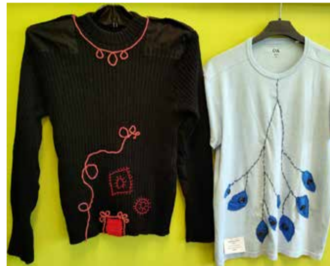
Võistlustööd – ülesandeks oli loominguiliselt parandada katkine kantud rõivaese.