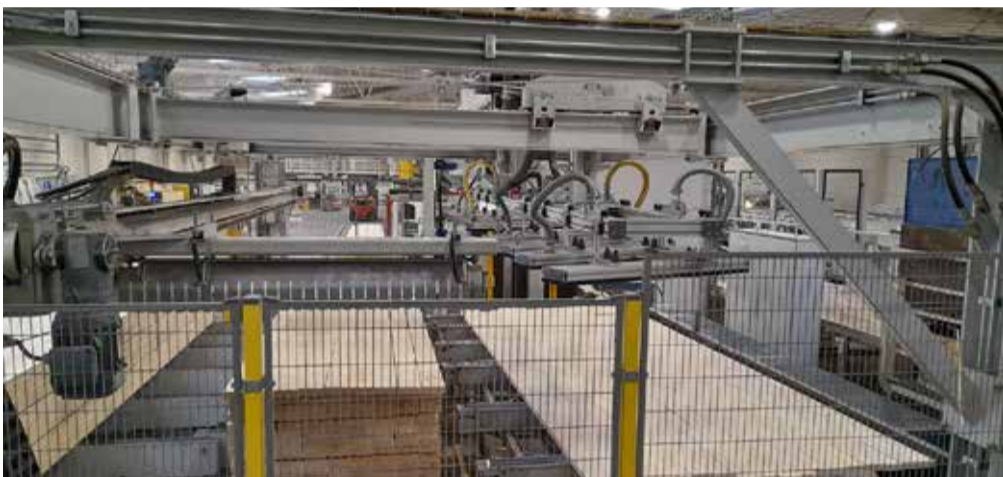
... ja VinCom OÜ-s.