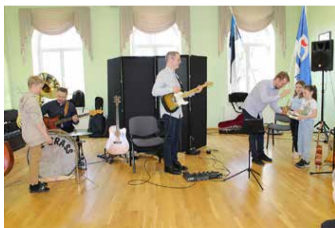
Ansambel Äge Brass.

3. klass külastas Suure-Jaani päästjaid. Põnev ja hariv külaskäik.