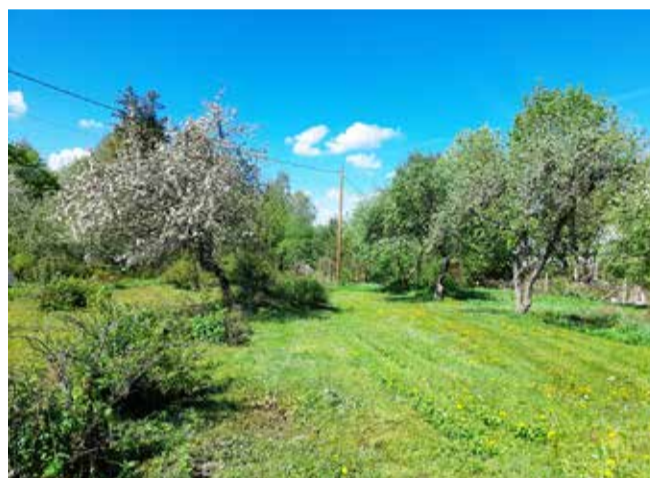
Aiamaad Pärnu tn 28a.