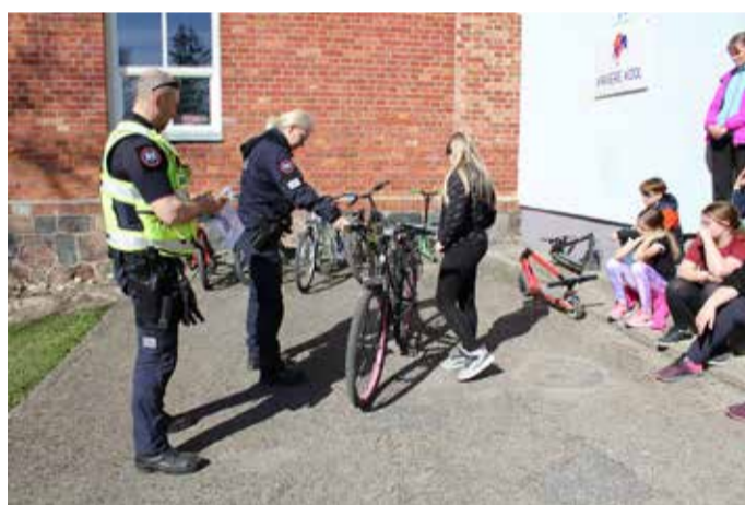
Jalgratate tehniline ülevaatus.

17. aprillil külastas meie kooli Võhma kooli näi-