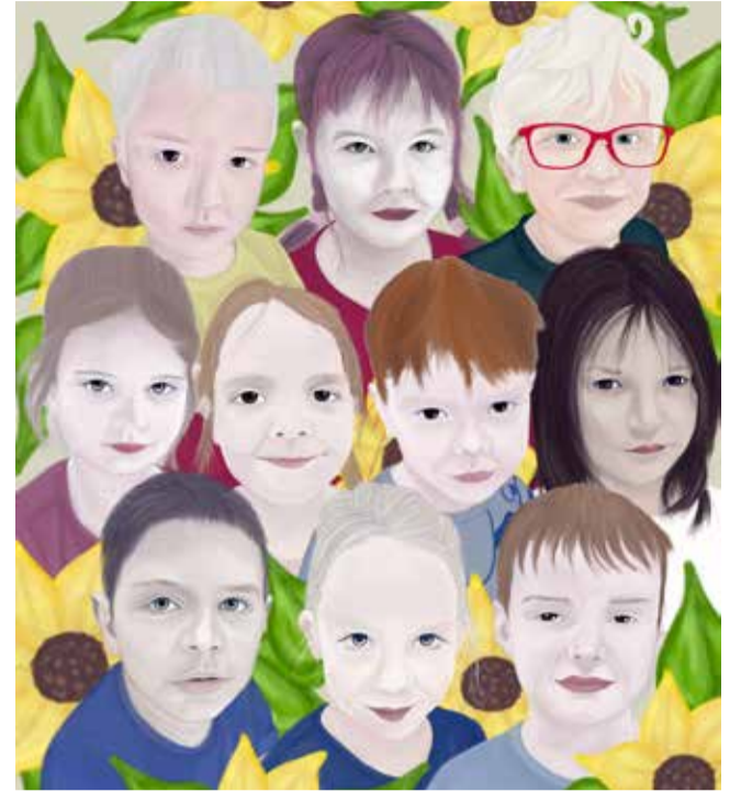
Digitaalne joonistus kooli minevatest lastest.