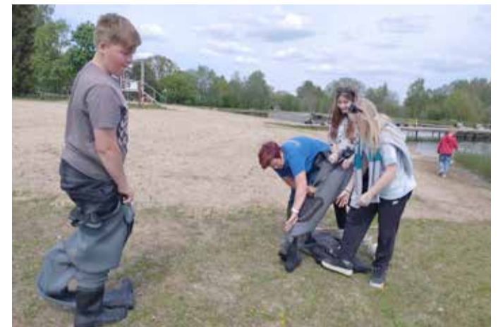
Varustus selga, et kahvaga veeorganisme püüda ja määrata.