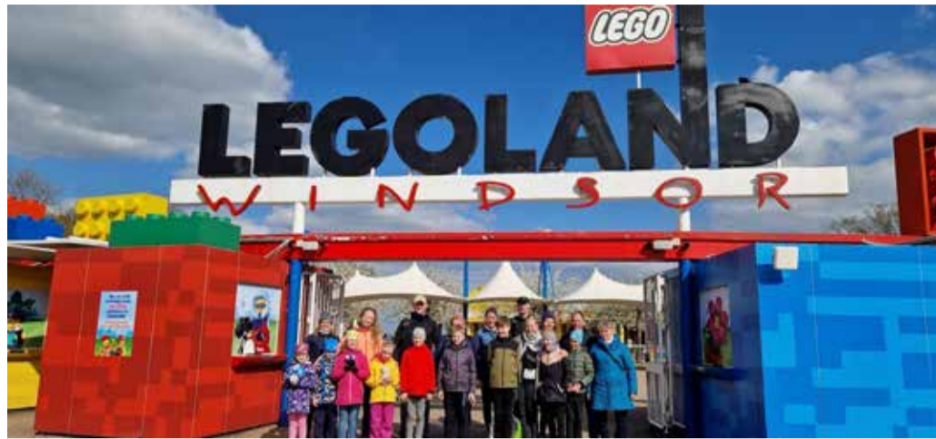
Windsori Legoland on Lego mänguasjade-teemaline atraktsioonide park.

Windsori loss – Suurbritannia kuninga suveresidents, maailma suurim loss, mida kasutatakse ka elamiseks. Meil oli õnn näha lossiruumi, jalutada ning nautida tohutut luksust ja suursugusust. Nägime ka, kus puhkab kuninganna Elizabeth II – Windsori lossi St. George kabelis.