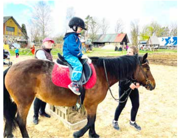
Külaskäik Vitsjärve ratsatalu.