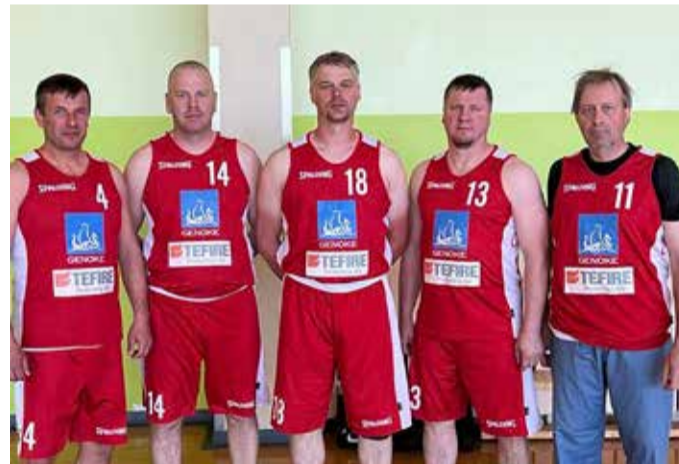
Korvpallurid Sakala mängudel.

Ratturid, kergejõustiklased ja korvpallurid tulid teiseks, tõstjad kolmandaks, jalgpallurid ja võrkpallurid saavutasid neljanda koha ja discgolfarid olid viiendad.