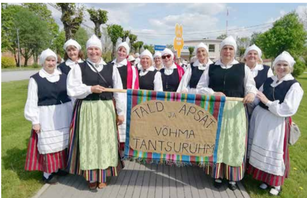
Väsimatu Võhma tantsurühm Tald ja Apsat Mõisaküla suveaias.