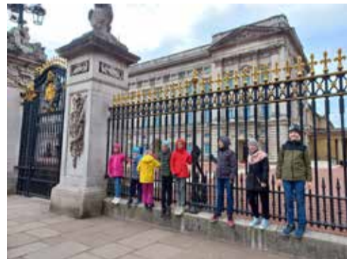
Windsori loss – maailma suurim ja kaunim elamuloss. Buckinghami palee on Suurbritannia sümbol.