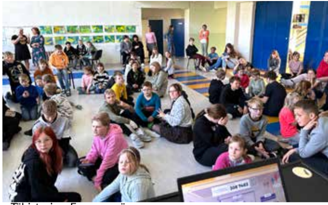
Tähistasime Euroopa päeva.