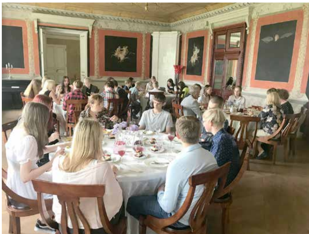
6.-9. klasside pidulik lõunasöök.

Maikuu toimusid ka meie kooli traditsiooni-