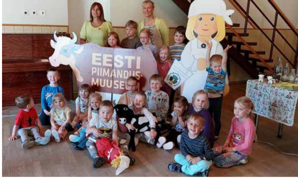
Lasteaialapsed koos Imavere Piimandusmuuseumi pedagoogidega pokteili töötoas.

Rühmade Killukesed ja Killud õppeaasta lõpuekskursioon toimus 12. mail. Sel korral küllastasime Torma