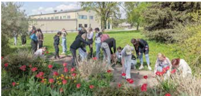
Lastekoor teeb ettevalmistusi seemnete külvamiseks.