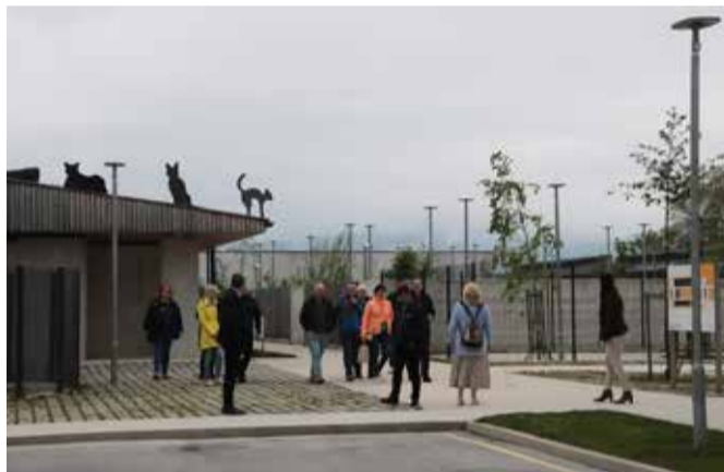
Ljubljana loomade varjupaigas.

Pea sama lummatuna tulime tagasi ka Ljubljana jäätme keskuse külastusest. Nendegi edu võtmeks on koostöö – lisaks pealinnale pakub üks regionaalne ettevõtte sama teenust veel 10 piirkonna omavalitsusele. Jäätmemajanduse korraldus tegi kadedaks – avalik ettevõtte Voka Snaga pakub teenust enam kui 400 000 elanikule, kõigile elanikele kehtib üks hind, mida iga-aastaselt uuesti arvatatakse. Kuna inimestele on prügi sorteerimine ja äraandmine mugav ning tasu teenuse eest mõistlik, toimib kõik kenasti. Arvutuslikult annab üks inimene ettevõttele kuus üle 15 l biojätmeid, 30 l segaolmejäätmeid, 60 l pakendijätmeid, 20 l paberi- ja 10 l klaasijätmeid. Jäätmejaamas suudetakse pea kõik kogutud jäätmed taaskasutatavaks muuta, biojätmed vä-