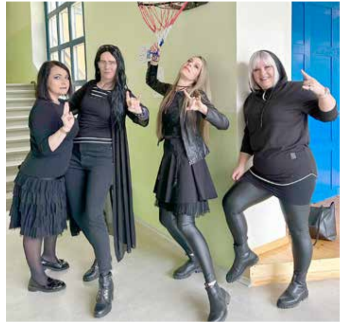
Stiilinädala häid leide.

Õpilasesindus korraldas aasta vältel mitmeid sündmusi, näiteks poistenädala ja tüdrukutenädala. Kõige fantaasiaküllasem oli stiilinädal.