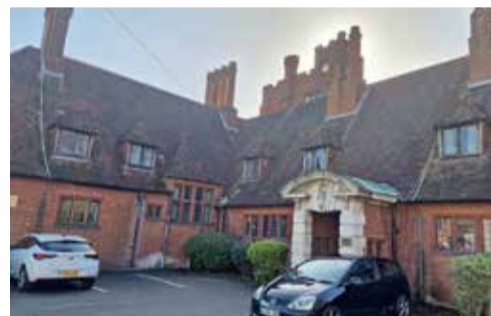
Selline loss siis ehk Moor Close, kus me ööbisime. Dinton Pasturesi mängupargi põnevad puitatraktsioonid.