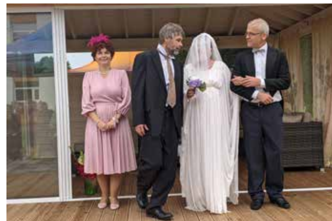
Aastal 2023.

Ürituse korraldamisele aitasid kaasa Põhja-Sakala Sotsiaalteenuste Keskuse töötajad.