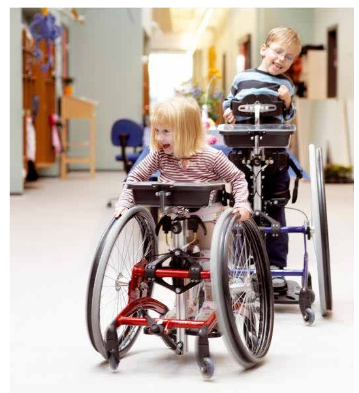
Õppetöös saab kasutada erinevaid abivahendeid.

Mõnikord peavad vanemad arvestama erimenetlusega, mis nõuab lisaaega. Erimenetlus on vajalik näiteks siis, kui soovitakse üürida samaaegselt mitut sama abivahendit riigi soodustusega või üürida üht