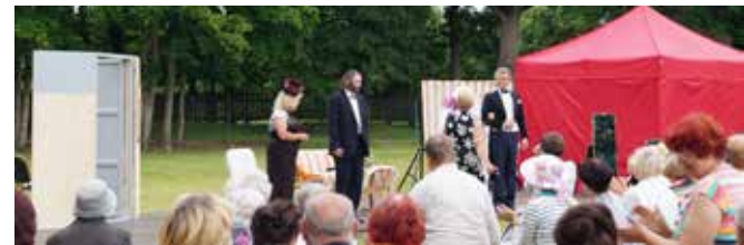
Aastal 2017.