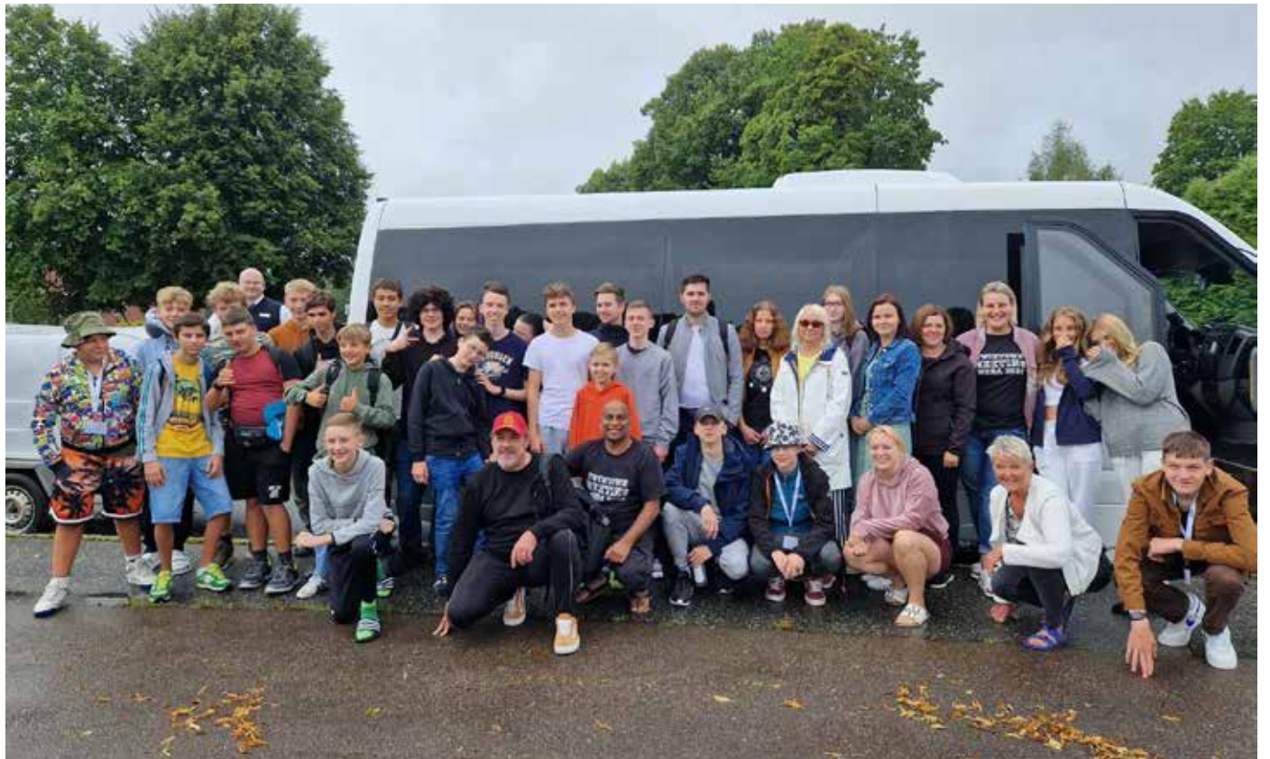
Sõpruskohtumisel osalenud omavalitsuste delegatsioonid.

1996. aastal sõlmitud leping nägi ette, et igal aastal toimuvad omavahe- lised koostööseminarid või -projektid, kus osalevad iga sõprusvalla delegatsioonid. Aastate jooksul on käsitletud mitmeid erinevaid päevakajalisi teemasid alustades Euroopa Liidust, keskkonnahoiust, sotsiaalhoolekandest ning lõpetades kultuuri, spordi ja vabatahtliku tegevusega. Lähtuvalt hetkel maailmas toimuvast, oli selleaastase kohtumise teemaks „If the crisis comes“ („Kui saabub kriis“). Läbi arutelude saime teada, kui valmis me erinevateks kriisideks oleme ja leidsime võimalusi, mida saame ise ära teha, et keerulistes olukordades toime tulla. Lisaks arutasime, kuidas omavalitsuse ja riigi tasandil tagatakse valmisolek kriisiks. Aruteludest selgus, et Rootsil puudub kokkupuude sõjaliseks kriisiks valmistumisel, seega nemad saavadki õppida vaid teiste kogemustest.