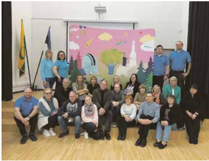
Õpetajad ESERO Eesti meeskonnaga.

Hariduslike erivajadustega õpilaste osakaal kasvab nii maailmas kui ka Eestis. Õpetajatööga käib kaasas