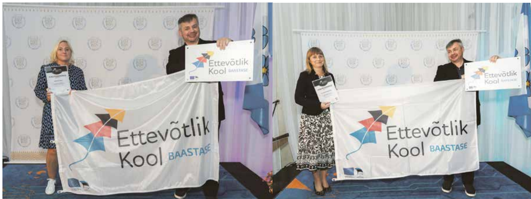
Ettevõtliku Kooli baastaseme märgis omistati Kirivere Koolile ja Olustvere Põhikoolile.