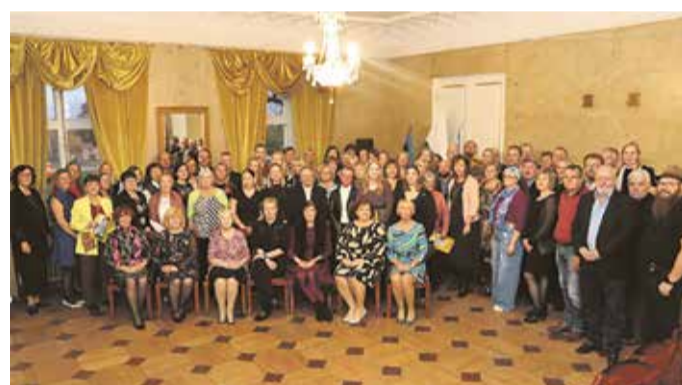
Kõpu kooli kokkutulek.

20. oktoobril tähistasime 255. aasta möödumist hariduselu algusest Kõpu kihelkonnas – toimus kooli vilistlaste kokkutulek. Pidulikul