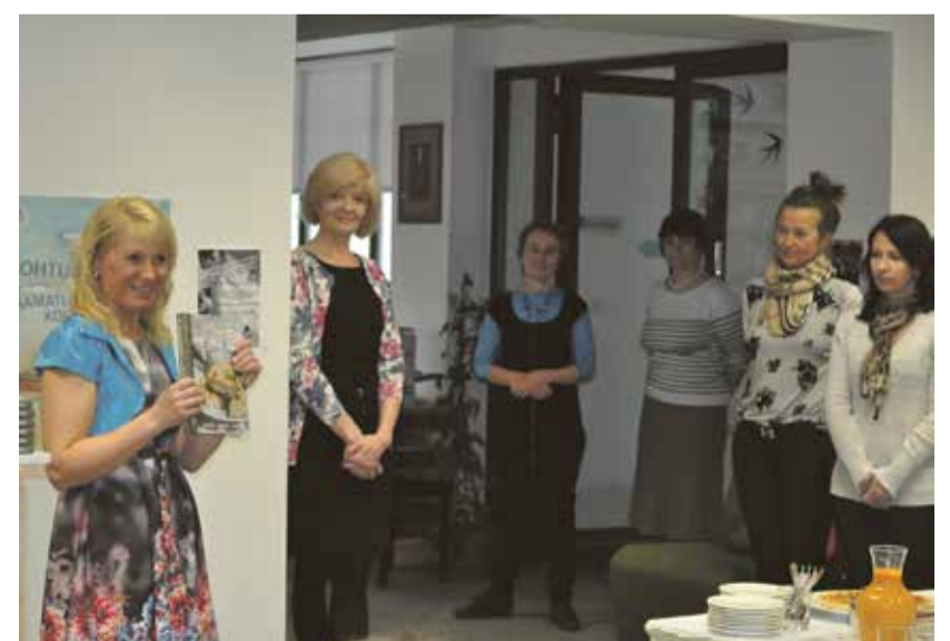
Õpetaja oma raamatut esitlemas.