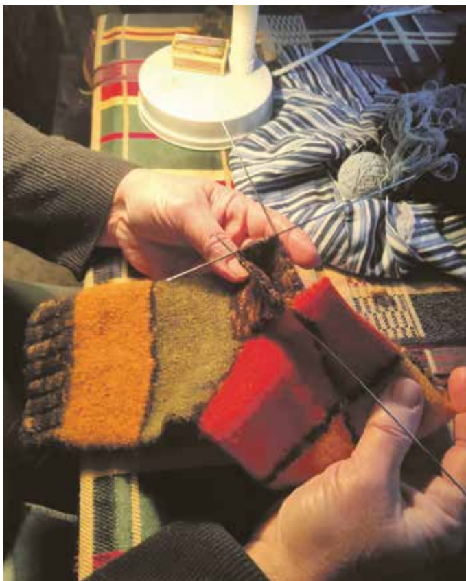
Kootud esemete paranduspäev heliloojate Kappide majamuuseumis.