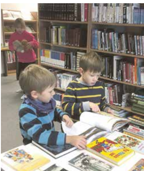
Olustvere lasteaia Muumi-rühm.

Raamatukoguhoidjad: Elvi Mägi ja Reet Marjapuu Aadress: Müüri 4, Olustvere, Põhja-Sakala vald, Viljandimaa Telefon: 437 4264; e-post: raamatukogu@olustvere.edu.ee Koduleht: https://olustverererk.weebly.com/