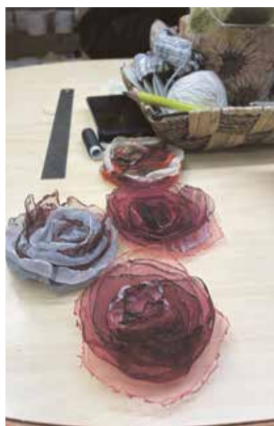
Lahmuse kooli õpilaste poolt valmistatud lilled klubi Meelespeale vastlapäevaks.

Sõidud tehtud, jätkus koosviibimine kultuurimaja puhkeruumi kohvilauas. Arutasime, mis teemadel pidusid korraldada, kuhu ekskursioonile minna, ehk mõni kontsert koos ära kuulata. Meiega koos oli ka kultuurikeskuse direk-