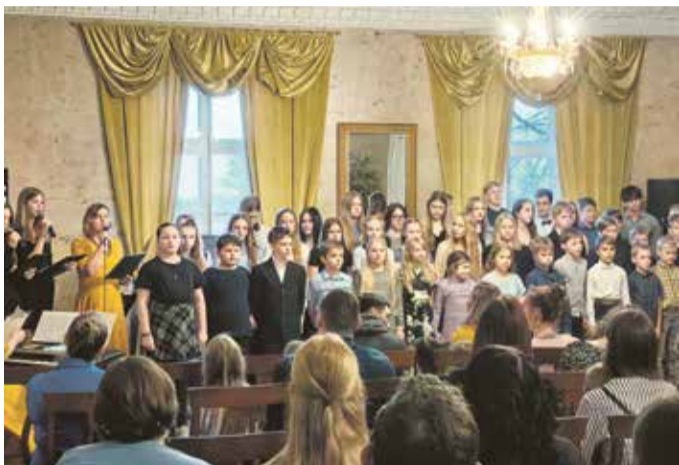
Vabariigi aastapäeva kontsertaktus.