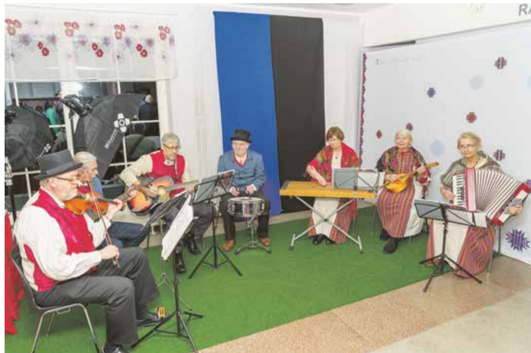
Saabujaid tervitas kapell Pilistvere Pillimehed.