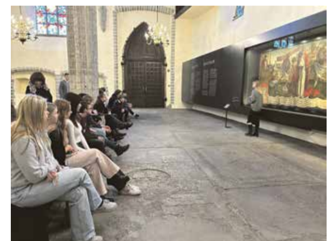
Kirivere Kooli 7.–9. klassi õpilased Niguliste kirikus tutvumas Bernt Notke maaliga „Surmatants“.