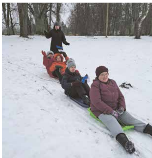
Klubi Meelespea vastlasõit.

Toreda üllatuse saime Lahmuse koolilaste val-