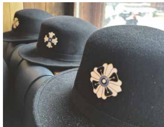
Naiskodukaitse piduliku vormi kübar.

Naiskodukaitse Sakala ringkond pöördub kõigi viljandimaalaste poole palvega ajaloo kogumisel ja talletamisel abiks olla. Me oleme huvitatud kõikvõimalikest antud teemaga seotud materjalidest (mälestused, kirjad, dokumendid, fotod, esemed jm) ning võtame need tänulikult vastu. Oleme tänulikud annetajatele ning samuti on abiks see, kui saame ajalooürikuid