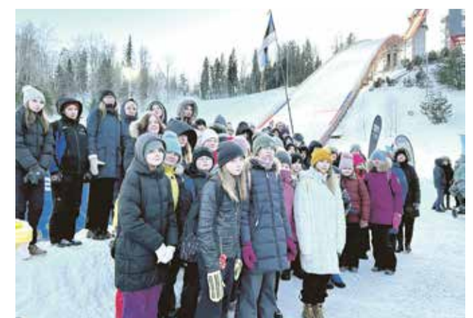
Kirivere Kooli 3.–9. klassi õpilased Tehvandi suusahüppemäe juures.