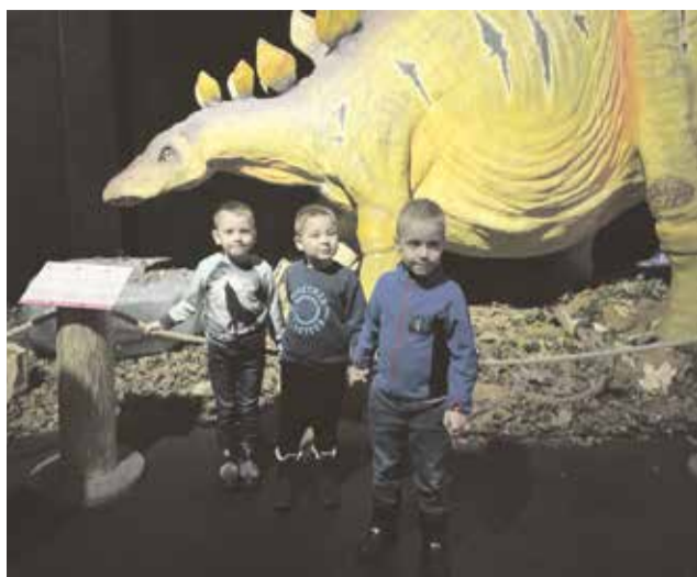
Kildude rühma poisid ja stegosaurus.

13. veebruari õhtul toimus lasteaias kogu pere vastlapäevatrall. Meie liikumisõpetaja Jane ja hoolekogu liikmete eestvedamisel leidis aset põnev seiklusmäng taskulampide valgel ning hoogsad kelguvõistlused. Meeleoluka õhtu lõpul kostitasime end sooja tee ja maitsvate vastlakuklitega, mille valmistamiseks olid kaasa aidanud ka lapsed ise. Suur tänu korraldajatele