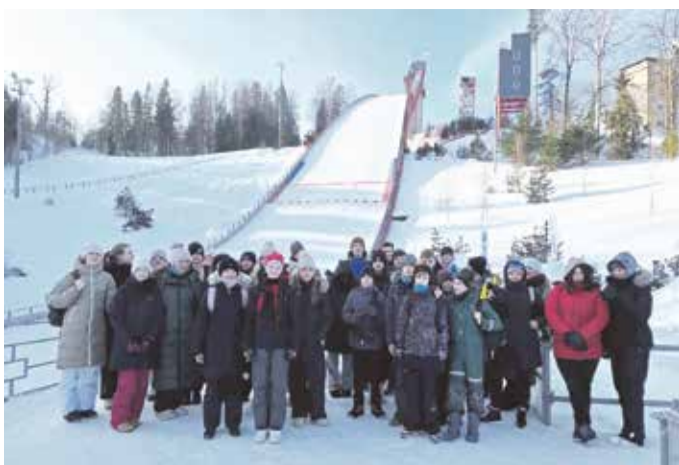
5.-9. klass Tehvandil.